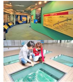
渦の道&大鳴門橋架橋記念館エディ・ セット入場券