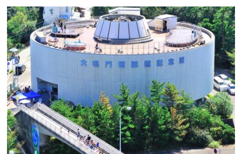
大鳴門橋架橋記念館エディ