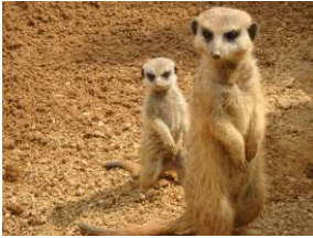
とくしま動物園・入園券