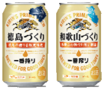
徳島づくり・和歌山づくり