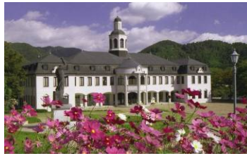
鳴門市ドイツ館・入場チケット