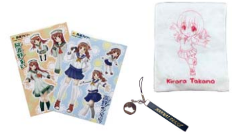
南海フェリーグッズ