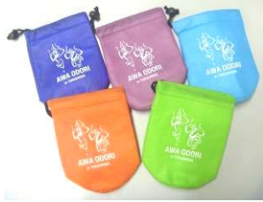
阿波おどりボトルホルダー